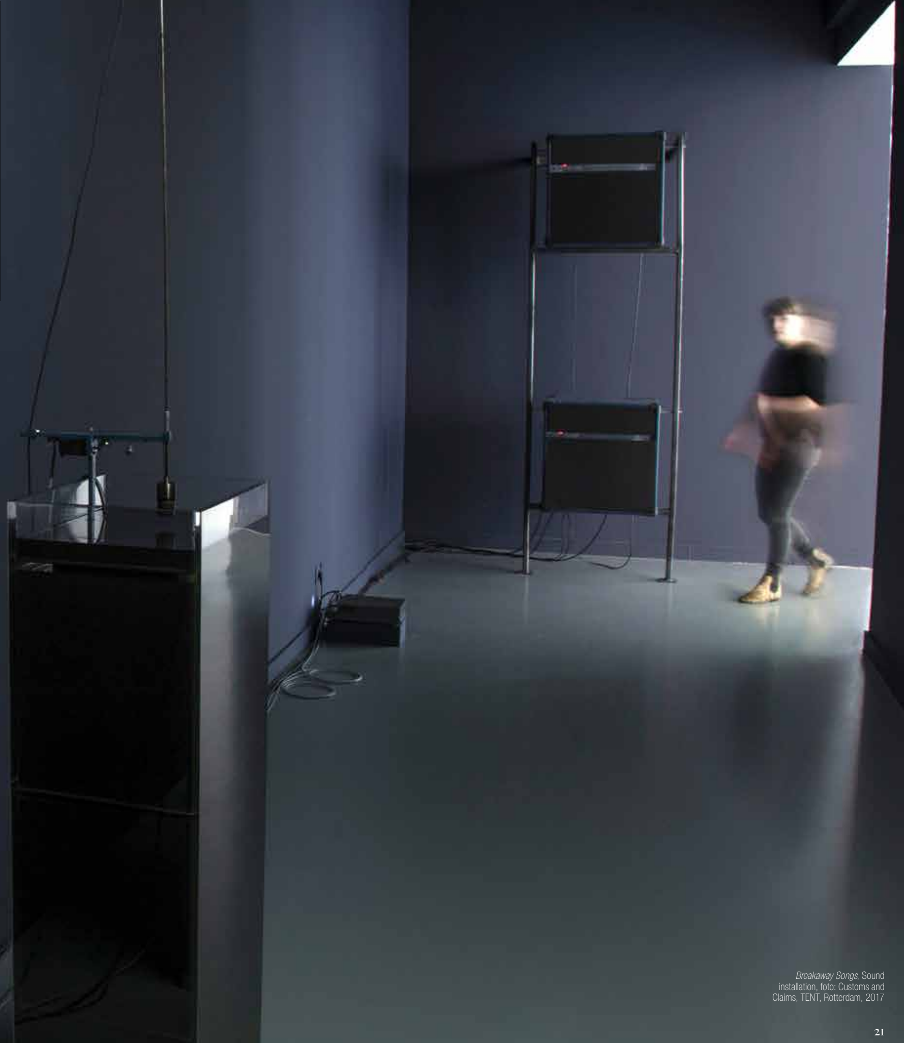
Breakaway Songs , Sound installation, foto: Customs and Claims, TENT, Rotterdam, 2017