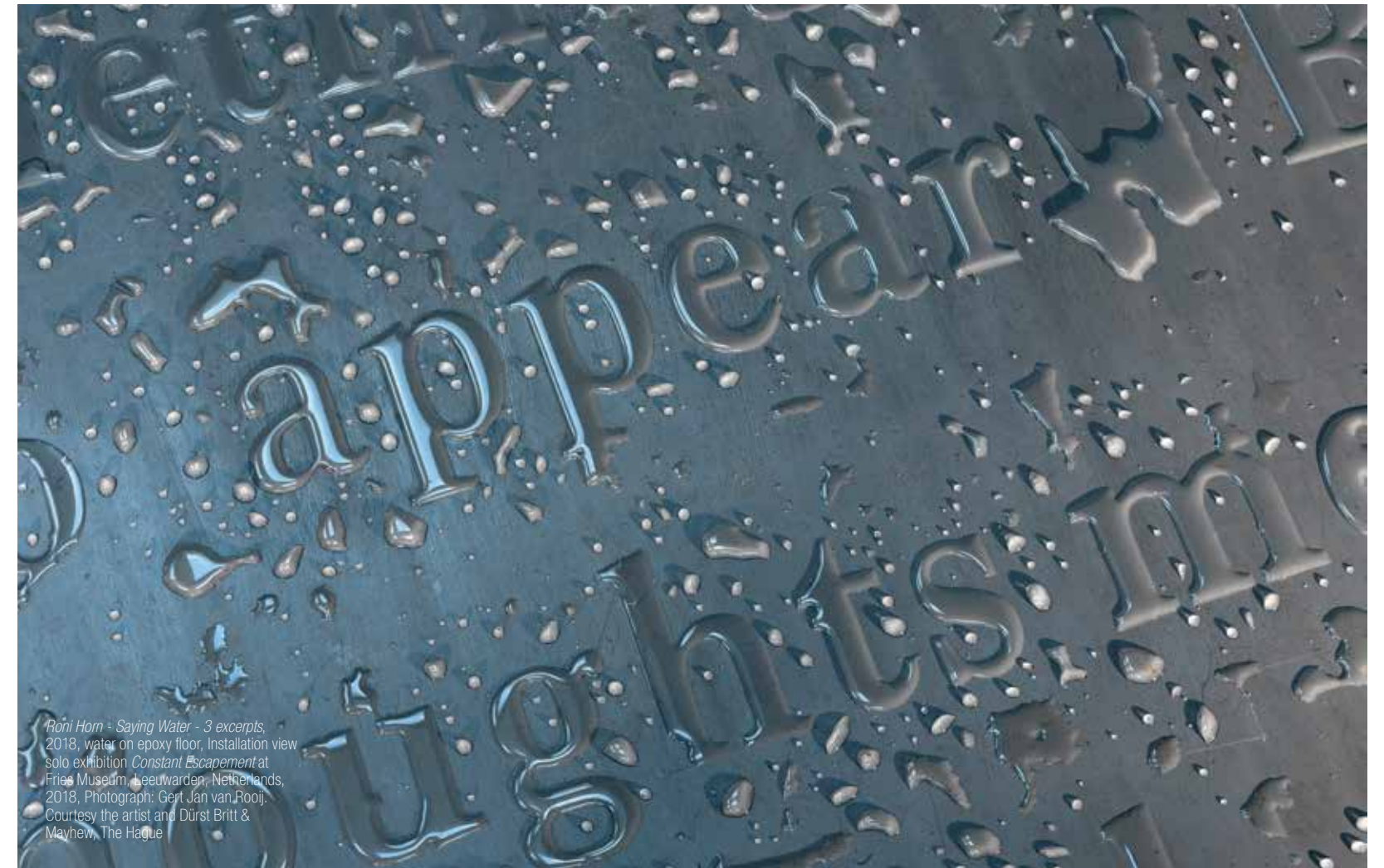
Roni Horn - Saying Water - 3 excerpts , 2018, water on epoxy floor, Installation view solo exhibition Constant Escapement at Fries Museum, Leeuwarden, Netherlands, 2018.