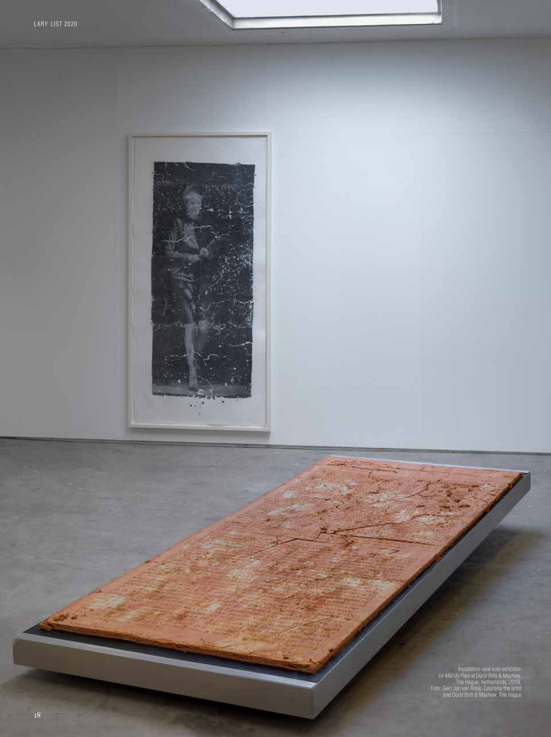
Installation view solo exhibition Le Mal du Pays at Dürst Britt & Mayhew, The Hague, Netherlands, 2019.