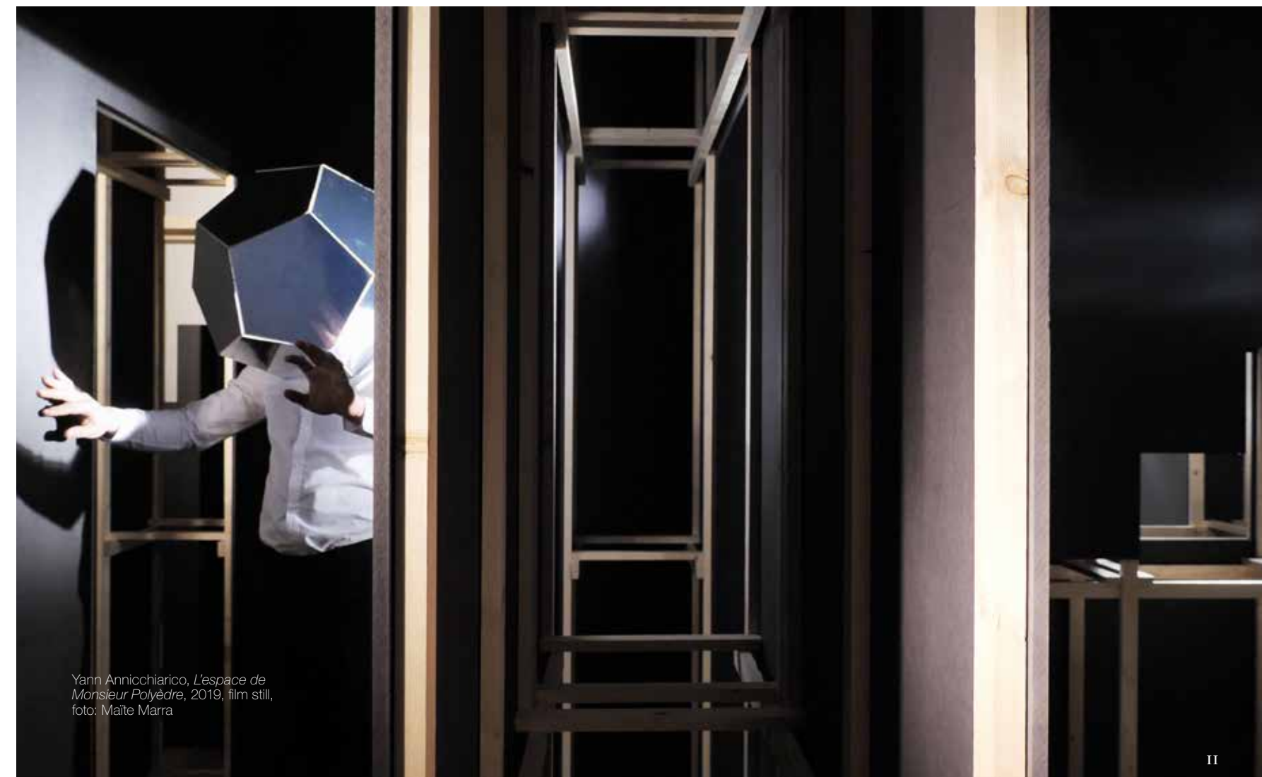
Yann Annicchiarico, L'espace de Monsieur Polyèdre , 2019, film still, foto: Maïte Marra