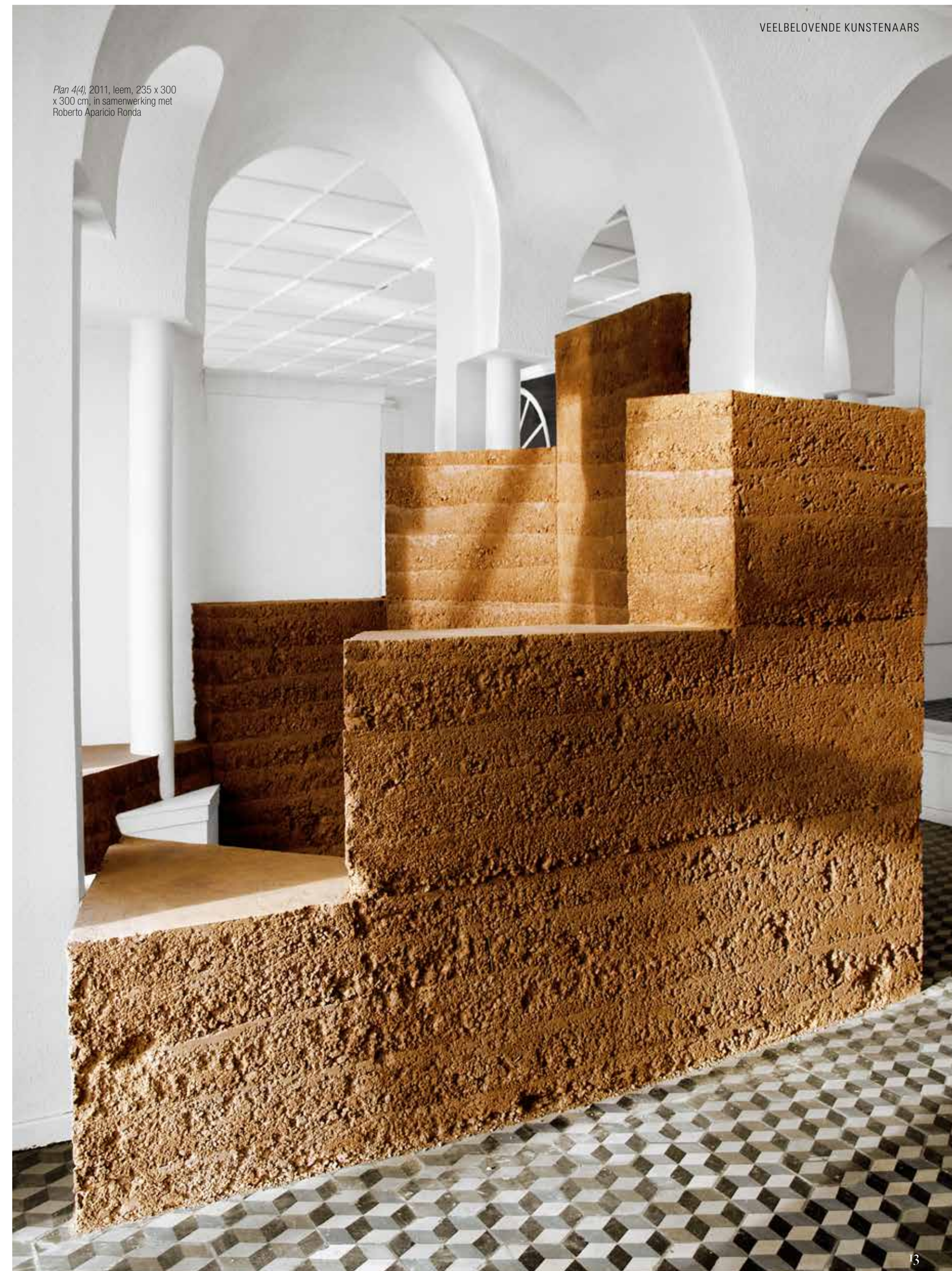
Plan 4(4) , 2011, leem, 235 x 300 x 300 cm, in samenwerking met Roberto Aparicio Ronda