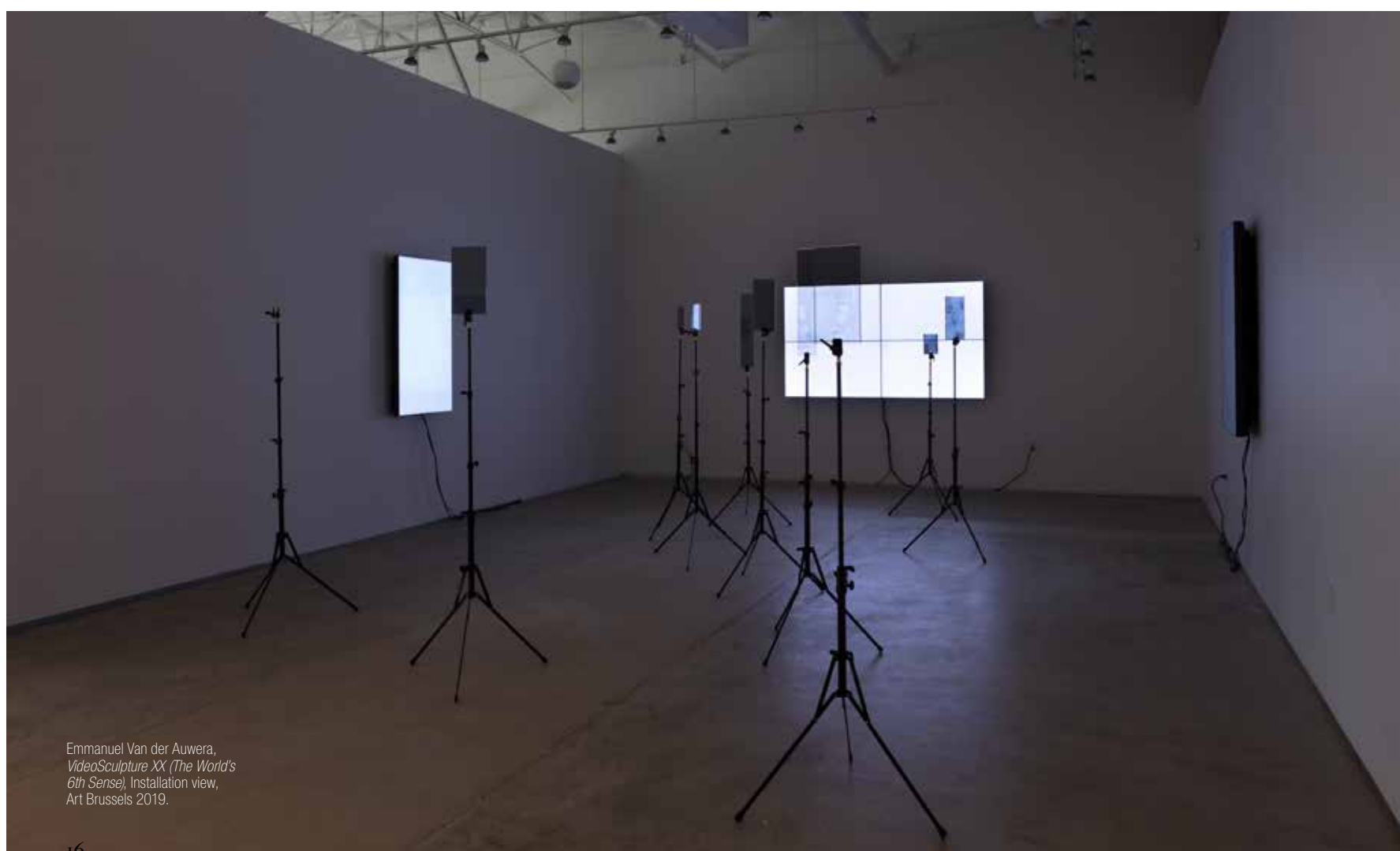
Emmanuel Van der Auwera, VideoSculpture XX (The World's 6th Sense) , Installation view, Art Brussels 2019.