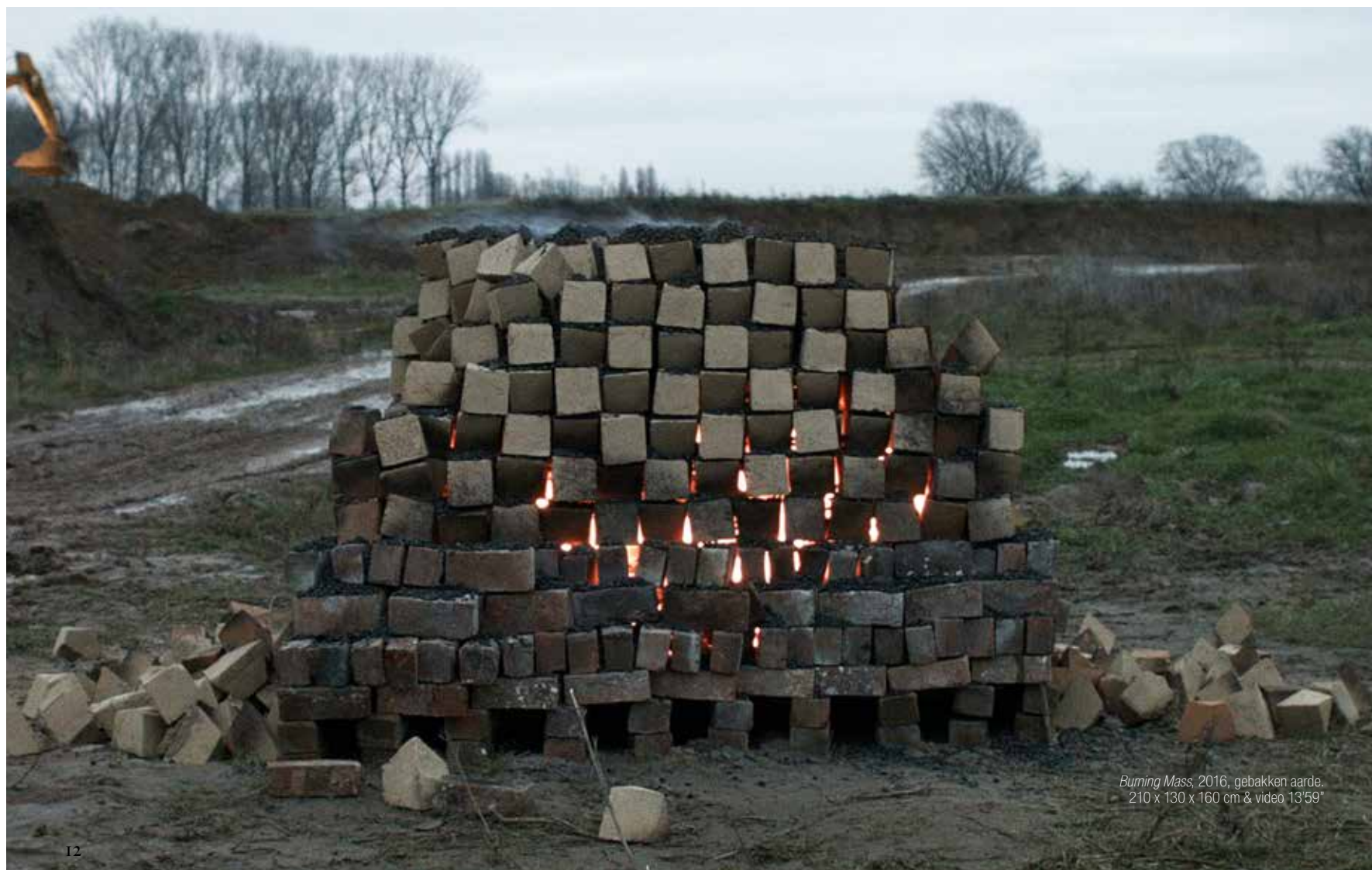
Burning Mass , 2016, gebakken aarde, 210 x 130 x 160 cm & video 13'59"