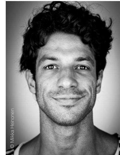
Yann Annicchiarico (b.1983, woont en werkt in Luxemburg)

Annicchiarico's kunstpraktijk bestaat uit verschillende door hem opgebouwde architecturale modules waar hij lichtarrangementen in aanbrengt. Met die lichteffecten stuurt hij de blik van bezoekers door tentoonstellingsruimtes en de richting die ze lopen. De film L'Espace de Monsieur Polyèdre was eerder onderdeel van zo'n installatie in Galerie Nosbaum Reding. Bezoekers liepen door de ruimte en troffen daar monsieur Polyèdre tastend en zoekend aan. Met een geometrische helm op zijn hoofd reflecteerde hij het felle licht richting bezoekers, die al tastend en zoekend hun weg vonden. Annicchiarico kreeg zijn opleiding aan de École Supérieure des Beaux-Arts in Lyon en had belangrijke exposities in Luxemburg, Frankrijk en Italië. In 2018 werd hij genomineerd voor de Luxemburgse LEAP Prize.